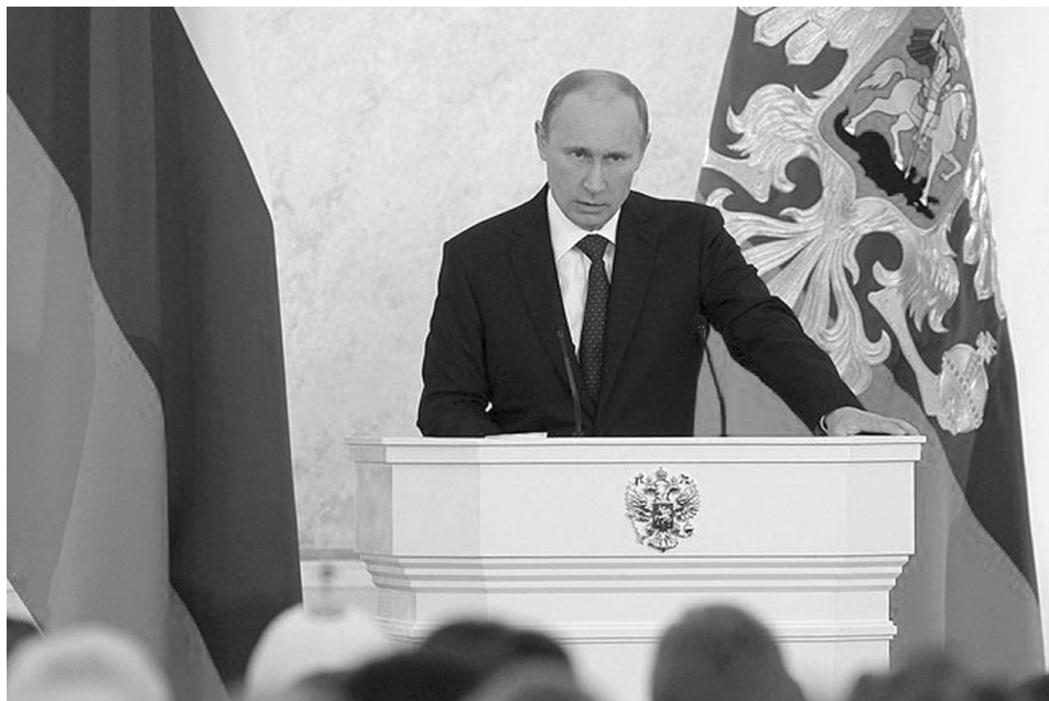
Владимир Путин огласил ежегодное