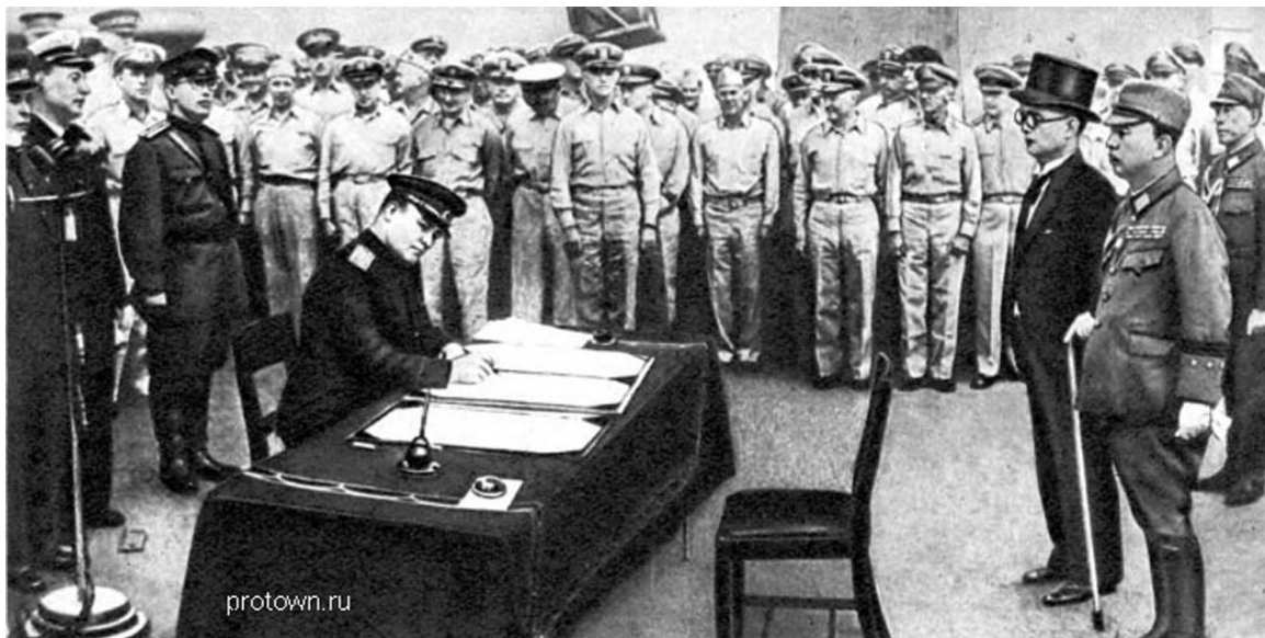
От имени Советского Союза Акт о безоговорочной капитуляции подписывает генерал К.Н. Деревянко.

Глава Вилючинского городского округа А. Сова, глава администрации городского округа Е. Липаков